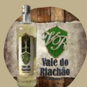
VALE DO RIACHÃO OURO OU PRATA