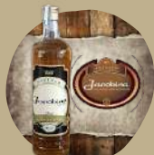
JACOBINA OURO OU PRATA