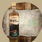
BAIXÃO DO COSMO OURO OU PRATA