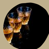
Trio degustação R$ 25,00